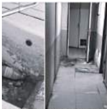
et des résidents et activistes dans le foyer Alibonni des