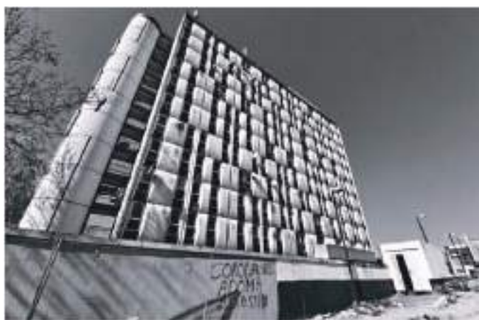
Bâtiment du foyer ADOMA

Cela se passe au camp de Fylakio, à côté de fleuve Evros qui marque la frontière entre la Grèce et la Turquie. Mardi 12 mai, des demandeurs d'asile ont manifesté pour dénoncer la lenteur des