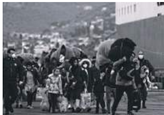
Mytilene - Lesbos - Migrants s'apprentent à embarquer