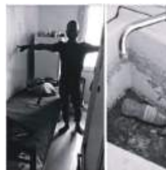
Capture d'écran d'une vidéo et photos prises par des ONG lillois en avril et mai 2020.