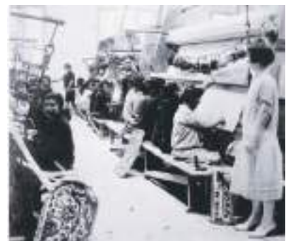
Ouvrières fabrique de tapis France-Orient